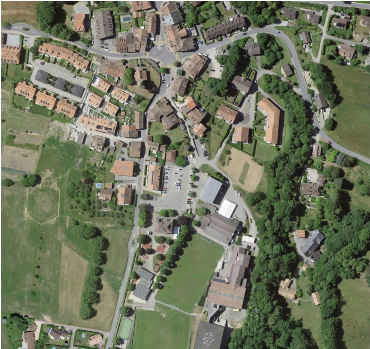
Figure 1 : Guichet cartographique cantonal de Vaud